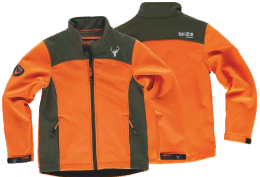
laranja a.v./verde caça

Tecido: 96% Poliéster 4% Elastano (300 g/m2)