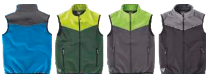
celeste/cinzeno verde escuro/amarelo a.v. cinzeno/verde lima preto/cinzeno