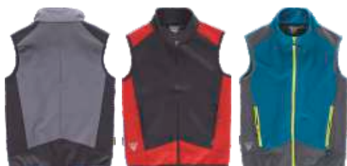
cizento/preto preto/vermelho azafata/cizento