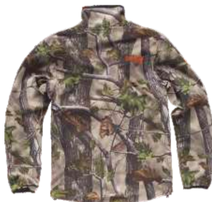
camuflagem floresta verde

Tecido: 96% Poliéster 4% Elastano (300 g/m 2 )