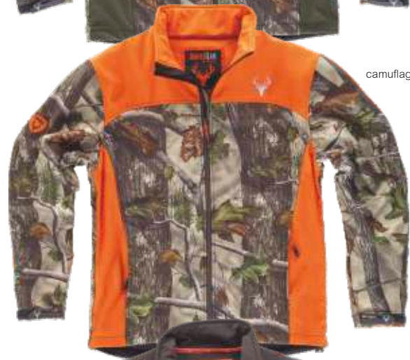
camuflagem verde floresta/laranja a.v.