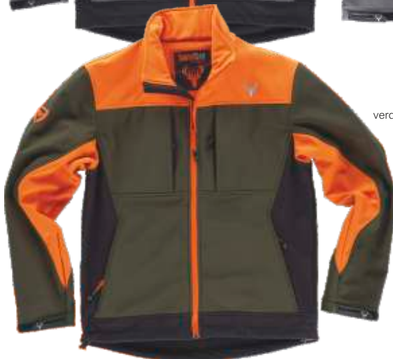
verde caça/preto/laranja a.v.