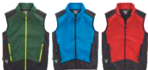
verde escuro/preto celeste/preto vermelho/preto