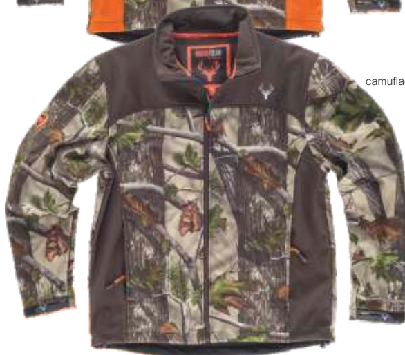
camuflagem verde floresta/castanho