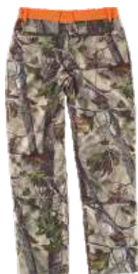
camuflagem verde floresta/laranja a.v.