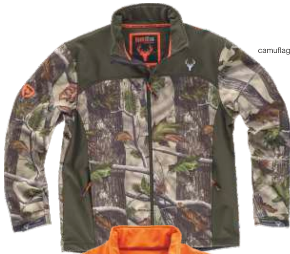
camuflagem verde floresta/verde caça