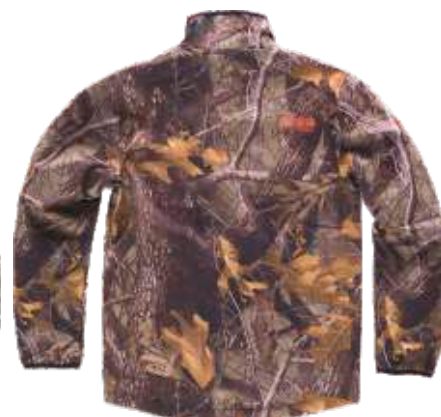
camuflagem floresta castanho