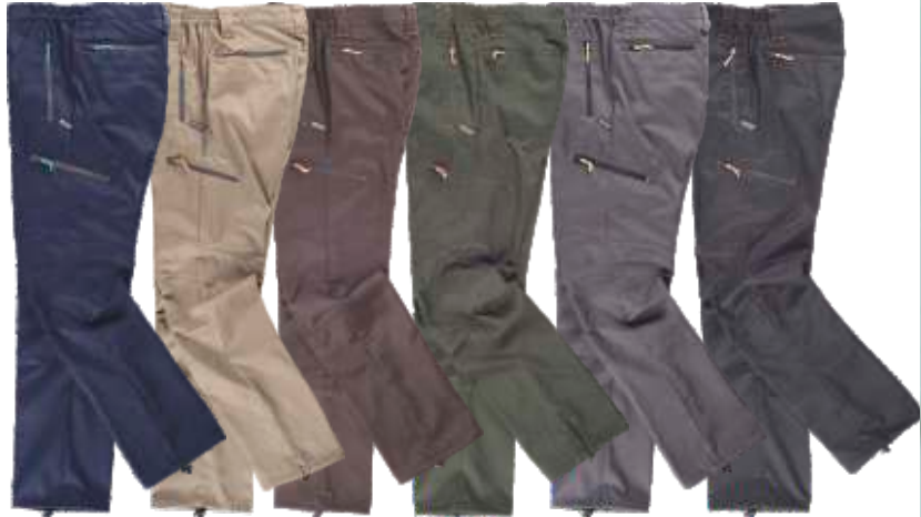
marinho bege castanho verde caça cinzento preto