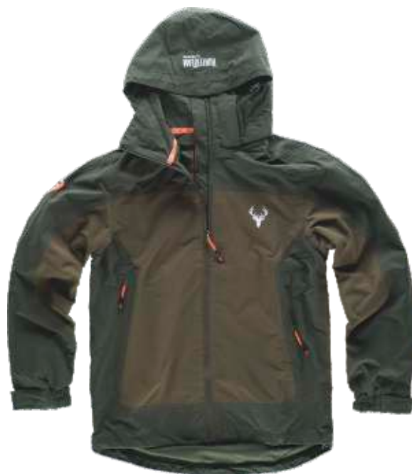
verde floresta/verde azeitona

Tecido Interior: 100% Poliéster (65 g/m2)