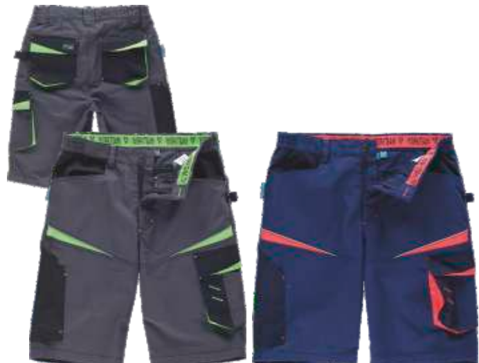
cinza escuro/preto/verde lima

Tecido: 65 % Poliéster 35 % Algodão (270 g/m2)