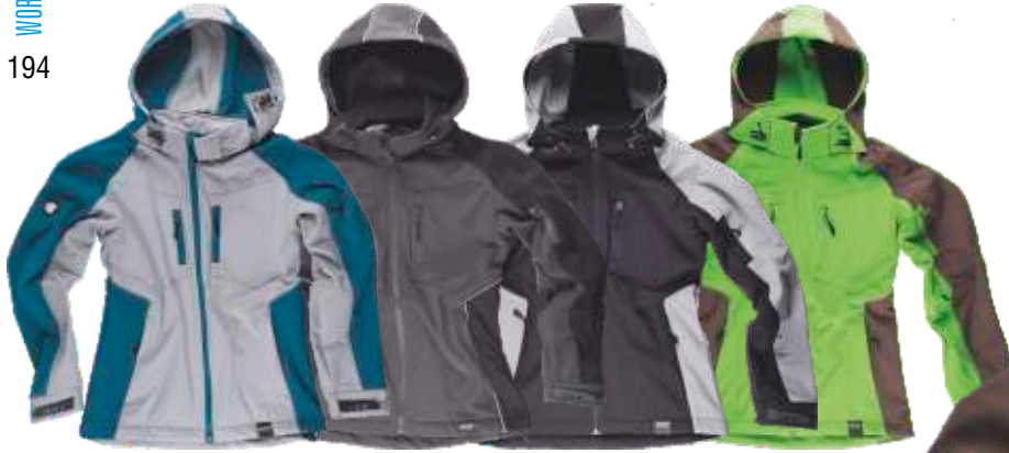
cinzento c./azafata cinzento e./preto preto/cinzento c. verde lima/castanho