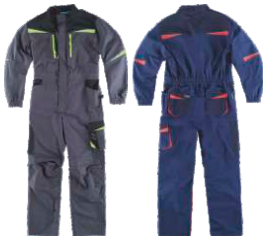
cinza escuro/preto/verde lima marinho/marinho escuro/vermelho a.v.