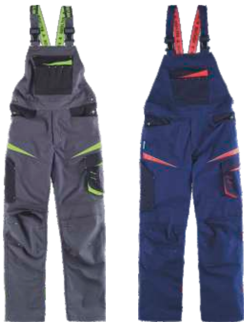
cinza escuro/preto/verde lima marinho/marinho escuro/vermelho a.v.

Tecido: 65 % Poliéster 35 % Algodão (270 g/m2)