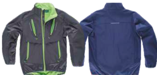
cinza escuro/verde lima