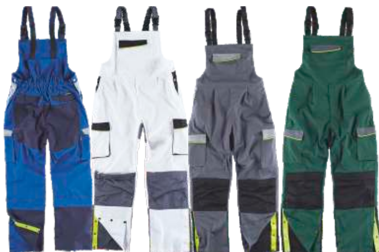
azulina/cinzento c./marinho branco/preto/cinzento e. cinzento e./cinzento c./preto verde e./cinzento e./preto

Tecido: 65% Poliéster 35% Algodão (155 g/m2)