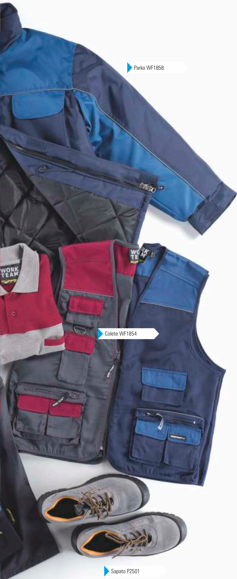
▶ Colete WF1854