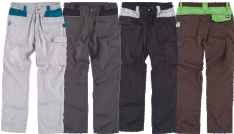
cinzento c./azafata cinzento e./preto preto/cinzento c. castanho/verde lima

Tecido: 96% Poliéster 4% Elastano (280 g/m2)