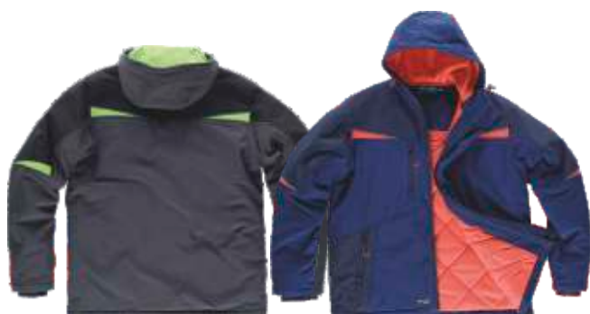
cinza escuro/preto/verde lima